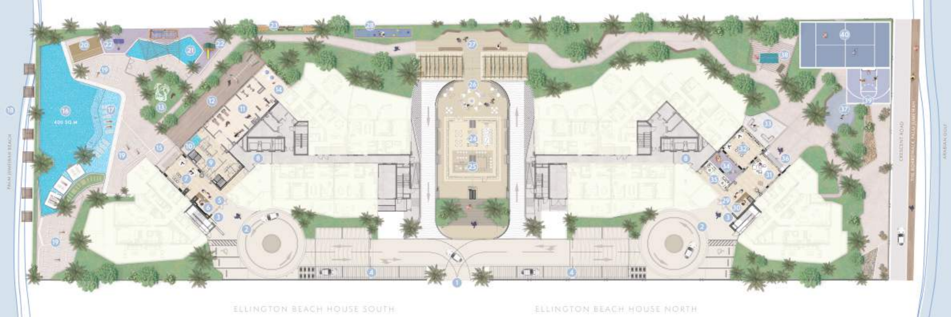
ELLINGTON BEACH HOUSE SOUTH